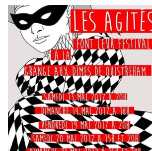
Affiche des représentations de spectacle de mai 2017