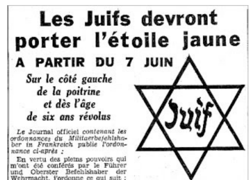
Le journal "Le Matin" du 1er juin 1942